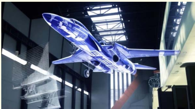
IMAGEN N° 16

Representación gráfica de las capacidades de los sistemas de IA en el diseño y mantenimiento predictivo en aeronaves. Imagen generada por una composición mejorada por IA mediante el sitio Leonardo.ai 36 .