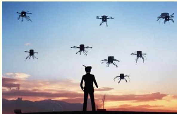
Representación de un Enjambre de Drones en operación. Imagen generada por una composición mejorada por IA mediante el sitio Leonardo.ai 22 .

En términos simples, los enjambres de drones controlados por IA están programados para actuar de la misma manera que los enjambres de insectos actúan en la naturaleza. Por ejemplo, cuando una abeja encuentra algo que podría beneficiar al resto de la colmena, informará esa información en detalle a las otras abejas. Los drones pueden hacer lo mismo. Son capaces de comunicar la distancia, dirección y elevación de un objetivo, así como