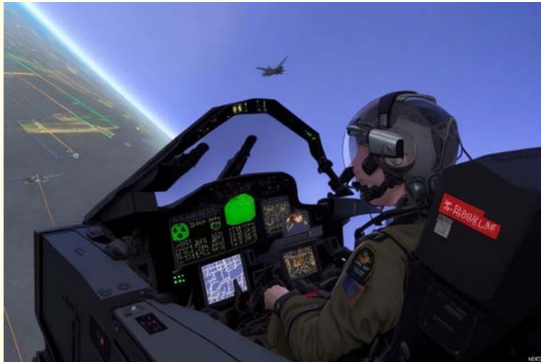
Representación futurística de un Entrenador de Combate Aéreo. Imagen generada por una composición mejorada por IA mediante el sitio Leonardo.ai 24 .