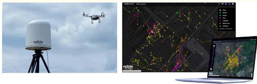
Representación de un radar IRIS® de detección radárica de drones y su representación gráfica del ploteo de drones de la empresa Robin Radar Systems, que se han beneficiado del análisis de señales usando algoritmos de IA. (Crédito: Robin Radar 18 ).