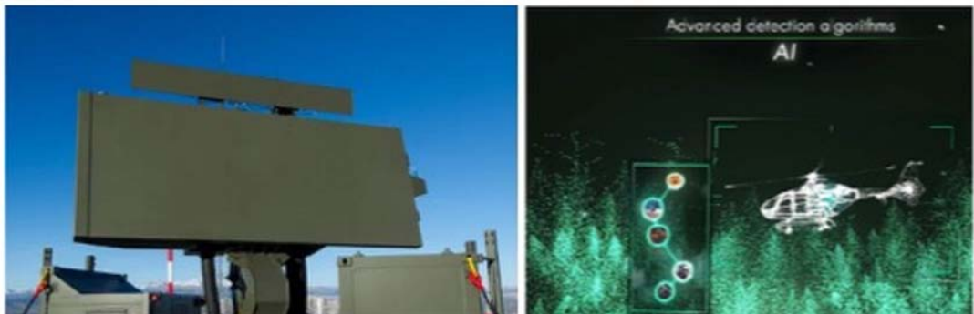
Representación de un radar de vigilancia GM-400 \alpha de la empresa Thales, que publica avances en su capacidad de detección utilizando algoritmos avanzados de IA. (Crédito: Thales 19 ).

En este campo existe experiencia de empresas nacionales que han participado en la integración de las telecomunicaciones asociadas a la información radárica y transmisión remota de voz y data, que se beneficiarían de la incorporación de aplicaciones de IA en sus procesos resultando en mejoras operaciones significativas. A la vez, permite avanzar en mejores niveles de autonomía y control de transmisión y codificación en el área de las radiofrecuencias.