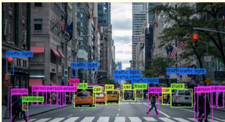
Representación del uso de Computer Vision y de Video Analytics en una situación urbana genérica.

Las aplicaciones militares de la IA se han incorporado en forma constante en las actividades y operaciones militares, con un claro potencial de seguir creciendo en importancia para su incorporación en las capacidades militares y aprovecharla en los conflictos futuros.