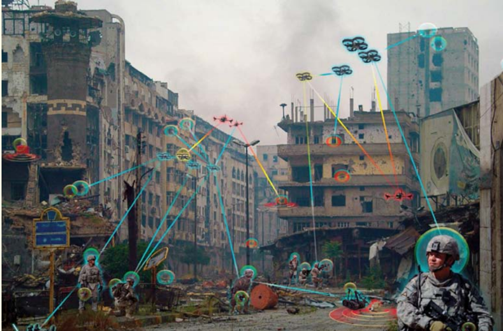
Representación de una patrulla militar empleando drones de reconocimiento en una situación de combate urbano. (Crédito: U.S. Army 17 ).

Igualmente, en el ámbito del Reconocimiento, los sistemas de IA presentes en las capacidades C4ISR pueden ayudar a hacer que el análisis de objetivos sea más preciso, aun en situaciones de combate y de alto riesgo. Los sistemas de reconocimiento basados en IA permiten mejorar la capacidad para identificar la posición de los objetivos, predecir el comportamiento del enemigo, anticipar vulnerabilidades, condiciones climáticas y ambientales, evaluar estrategias de misión y sugerir planes alternativos. Todas estas ayudas pueden contribuir en forma significativa al éxito de las operaciones, disminuyendo la posibilidad de bajas propias.