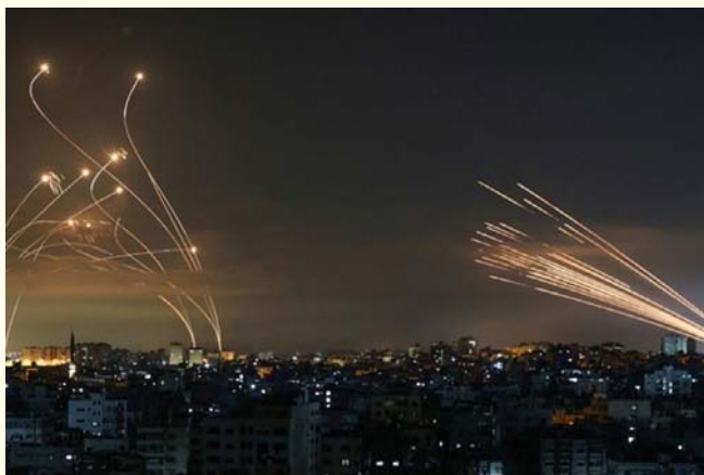
Imagen del Sistema Iron Dome en operación en contra de cohetes lanzadas desde la Franja de Gaza. El éxito de este tipo de sistemas es altamente dependiente de las decisiones automatizadas.