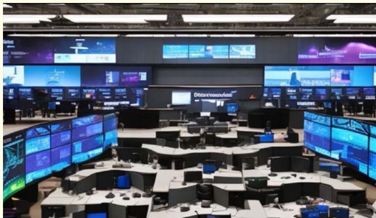
Representación futurística de una sala de operaciones para enfrentar situaciones de Ciberseguridad y Ciberdefensa, utilizando sistemas asistidos por IA. Imagen generada por una composición mejorada por IA mediante el sitio Leonardo.ai 29 .

Este doble impacto significa que es fundamental que las organizaciones de Seguridad y Defensa estén en constante desarrollo de capacidades para el manejo de soluciones en el mundo de la IA, como única solución para mantener su eficiencia operacional en medio de un panorama en constante evolución y de riesgos de ciberataques con sistemas asistidos por la IA. En otras palabras, el mantenerse al día en los sistemas basados en IA constituye “un elemento diferenciador para mantenerse a la vanguardia en cuanto al uso de las tecnologías, procedimientos, equipamiento y capacidades de la ciberdefensa nacional, tanto en acciones de legítima defensa, como efectos de disuasión y manejo de crisis... Así, la IA se presenta como una nueva herramienta para mantener el ciberespacio libre, abierto, seguro y resiliente y, con ello, cumplir los objetivos señalados en nuestra actual Política Nacional de Ciberseguridad” 30 .