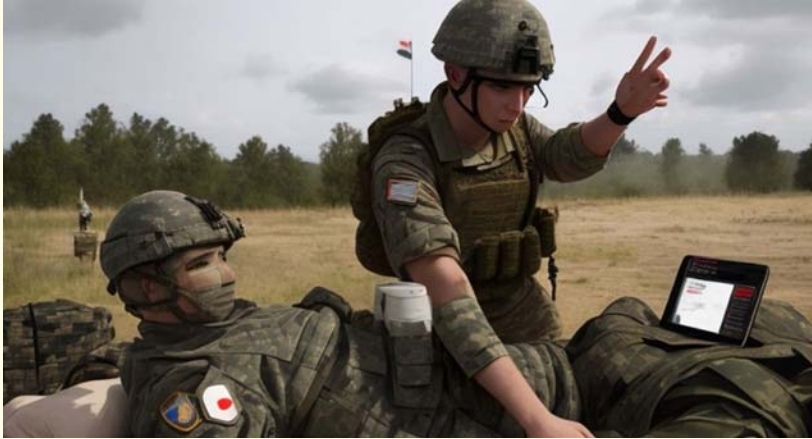
Representación de soldados prestando primeros auxilios a personal en el campo de batalla. Imagen generada por una composición mejorada por IA mediante el sitio Leonardo.ai 39 .

En el caso de las atenciones de urgencias durante situaciones de emergencias o catástrofes en donde tengan que actuar las Fuerzas Armadas, estas pueden ser asistidas por telemedicina asistida por IA, o incluso por sistemas más autónomos de tratamientos médicos asistidos por IA. Si bien los sistemas de IA no han alcanzado aún el desarrollo que les permita estar calificados para tomar decisiones médicas autónomas, pueden ayudar a proporcionar un análisis rápido para dar a los equipos en terreno más información sobre la cual basar sus decisiones, mediante algoritmos basados en el análisis automatizado de signos vitales y bases de datos médicos, combinados con información ingresada manualmente, para proporcionar indicaciones, advertencias y sugerencias para estabilizar a las víctimas, en espera de atención médica en instalaciones mejor habilitadas.