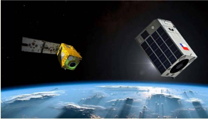
IMAGEN N° 15

Representación gráfica de las actuales capacidades satelitales de Defensa. Se representa la conjunción de los satélites FASat Charlie (izquierda) y el FASat Delta (Derecha), ambos en operación. (Crédito ilustración satélites: Fuerza Aérea de Chile) 34 .