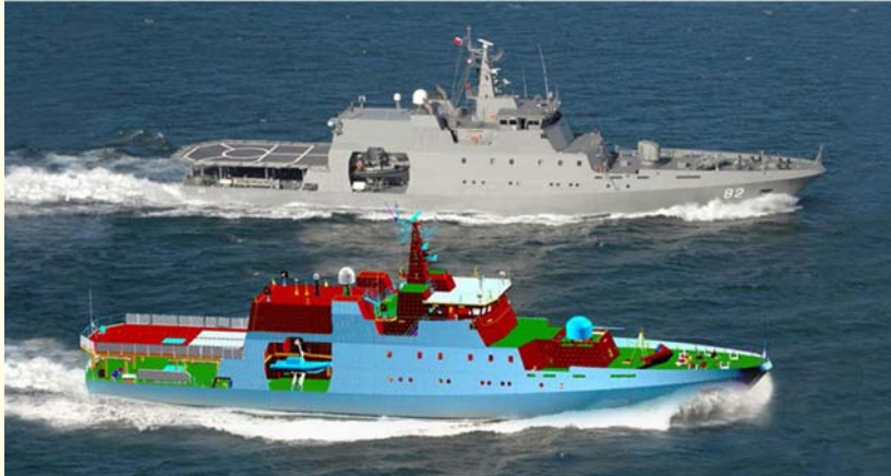
Representación gráfica de las capacidades de diseño de plataformas navales de ASMAR, como parte de las capacidades de I+D+i de las Empresas Estratégicas de la Defensa. 37 .

Los mismos conceptos son aplicables a los sistemas navales y terrestres. Por ello, es fundamental que las llamadas Empresas Estratégicas de Defensa (FAMAE, ASMAR y ENAER) se integren activamente a los procesos de investigación, innovación, desarrollo, trabajando conjuntamente con otras empresas, universidades y centros de investigación nacionales, para alcanzar la capacidad de manejo eficiente de los sistemas asistidos por IA. De esta manera, se contribuye al desarrollo tecnológico e industrial del país, disminuyendo la dependencia de proveedores externos, evitando generar vulnerabilidades de continuidad operacional.