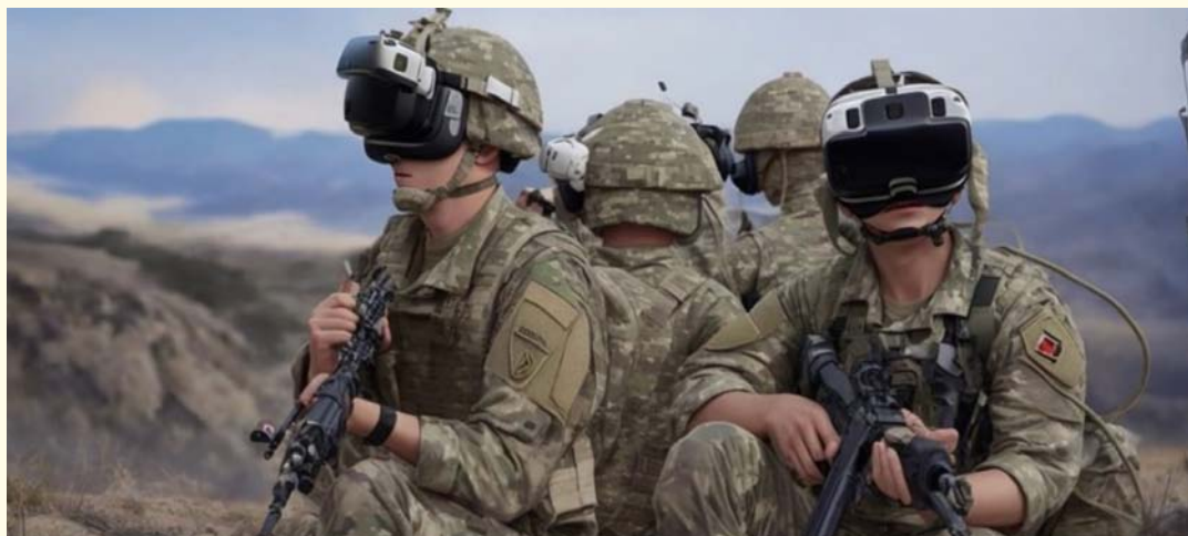
Representación de Soldados empleado sistemas de Realidad Virtual/Aumentada en operaciones de combate. Imagen generada por una composición mejorada por IA mediante el sitio Leonardo.ai 5 .

Sin duda, en el área de las aplicaciones de IA en Defensa, ha existido un progreso significativo en el campo del análisis de imágenes y videos, en donde se han logran resultados sorprendentes. De hecho, el análisis de imágenes de reconocimiento mediante