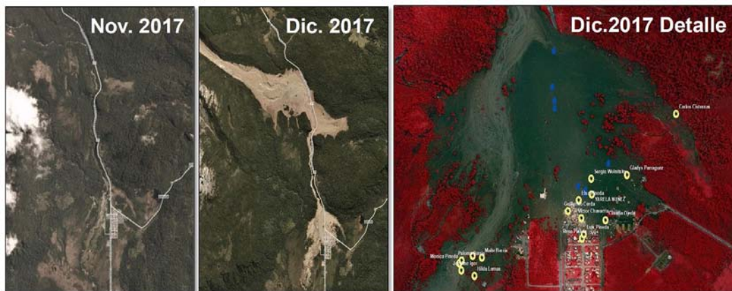
Serie de fotografía satelital de la localidad de Santa Lucía y sus alrededores obtenida por el Satélite FASat Charlie antes y después del aluvión del año 2017. 33 .

Los sistemas de IA en el campo espacial nacional también pueden ser de mucha ayuda para el uso eficiente de los recursos satelitales en la planificación de grandes áreas de vigilancia, correlacionando datos satelitales obtenidos de sensores electrónicos, imágenes radáricas y ópticas, en conjunto con información de diversas fuentes, tal como se requiere para la protección de las Zonas Económicas Exclusivas y la vigilancia de las áreas de conservación marítimas especiales suscritas por tratados internacionales.