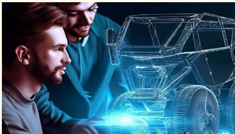
IMAGEN N° 18

Representación gráfica de las capacidades de diseño de sistemas terrestres utilizando sistemas asistidos por IA. Imagen generada por Bing Image Creator (Crédito: Raylex S.A.) 38 .