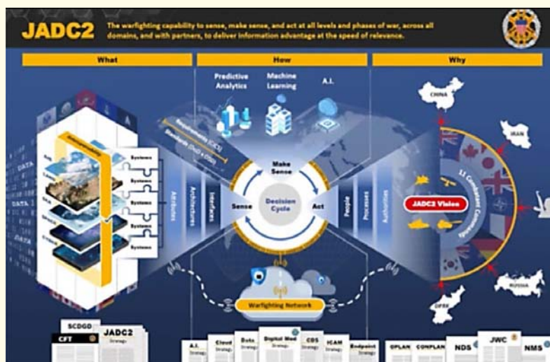
Representación del flujo decisional del Sistema JADC2 usando Ciencias de Datos Aplicadas.

Al igual que en los EE. UU., nuestro país busca alcanzar capacidades de Mando y Control ágiles y flexibles, en donde se incluyen las capacidades para apoyar la toma de decisiones oportunas, apreciar la situación en forma comprensiva, crear entendimiento compartido, planificar, preparar, conducir y evaluar las operaciones militares, en todas las situaciones y niveles de conducción, así como en las diferentes dimensiones y escenarios en que debe actuar la Defensa 12 .