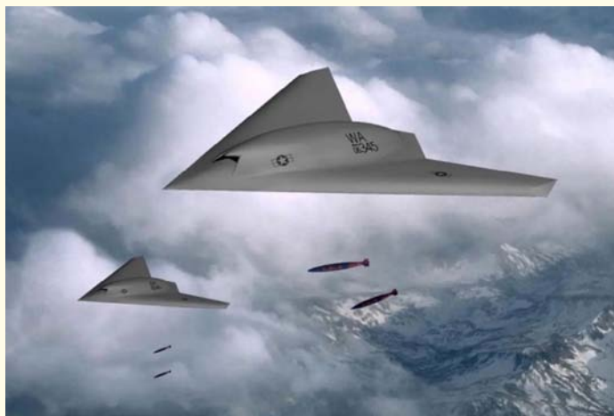
Representación de drones de combate experimentales X-45A de la empresa Boeing Aircraft Company.

En un segundo caso, son los propios sistemas de armas los que utilizan las aplicaciones de IA y efectúan las operaciones. Estas son las llamadas “armas autónomas” que presentan ventajas, pero también serios cuestionamientos para su uso seguro y ético. La ventaja más aludida para estos sistemas es que se reduce el impacto del error humano.