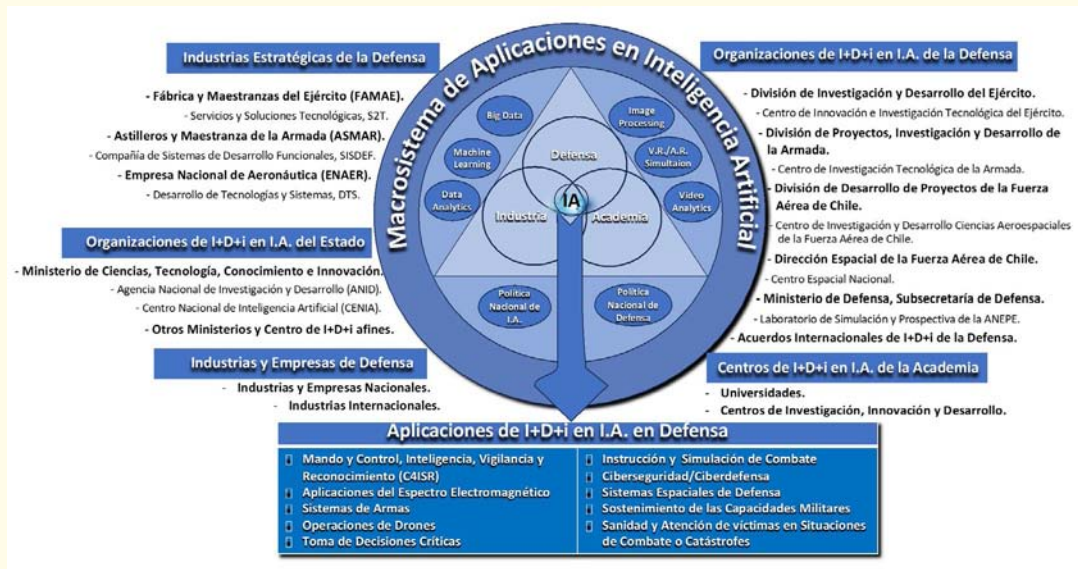
IMAGEN N° 20

Representación del Macrosistema de las Aplicaciones en Inteligencia Artificial, la complementación de la triada Defensa-Industria-Academia y los diferentes actores a nivel nacional, que pueden integrar sus esfuerzos para alcanzar logros en I+D+i en Sistema de IA. (Crédito: Creación propia del autor).