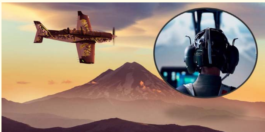
Representación del avión Pillán 2, como parte del nuevo Sistema de Instrucción de Vuelo Integrado de la Fuerza Aérea de Chile.

Hoy la industria nacional de Defensa tiene una oportunidad única de incorporar sistemas de IA en simulación de vuelo y análisis predictivos de habilidades en vuelo, con el desarrollo de los llamados Sistemas Periféricos del nuevo Sistema de Instrucción de Vuelo Integrado del proyecto Pillán 2. Estos sistemas están en etapas iniciales de desarrollo a nivel mundial, por lo que Chile tiene la oportunidad de generar innovación que podría traer